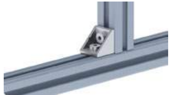
Aluwinkel 20 Alu Connection Angle 20