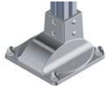
Pfostenkonsole Floor Mount Base