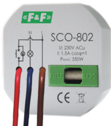
Schéma de câblage

L'intensité lumineuse peut être commandée au moyen de plusieurs commutateurs dans un montage en parallèle, répartis en plusieurs endroits à l'intérieur d'une pièce.