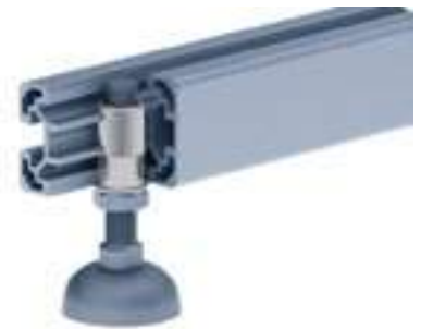
Gewindehülse Threaded Sleeve