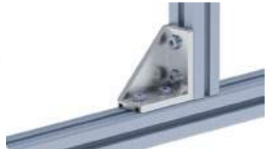
Aluwinkel 30/60 Alu Connection Angle 30/60