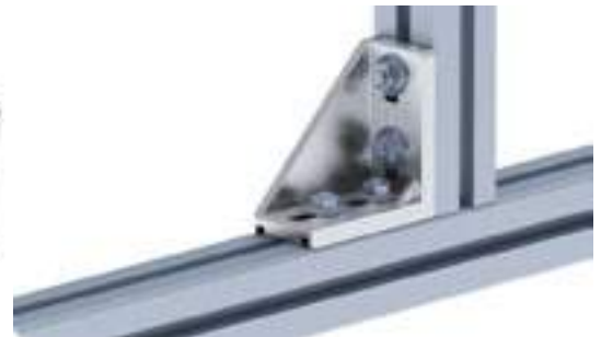
Aluwinkel 40/80 Alu Connection Angle 40/80