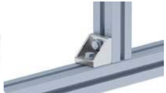
Aluwinkel 45 T Alu Connection Angle 45 T