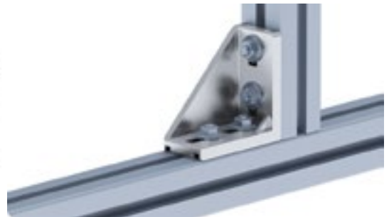
Aluwinkel 45/90 Alu Connection Angle 45/90