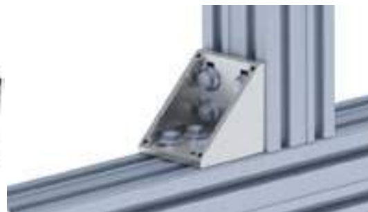
Aluwinkel 80 Alu Connection Angle 80