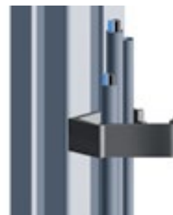
Clip-Kabelbinder mit Hammer Clip Cable Binder with Hammer