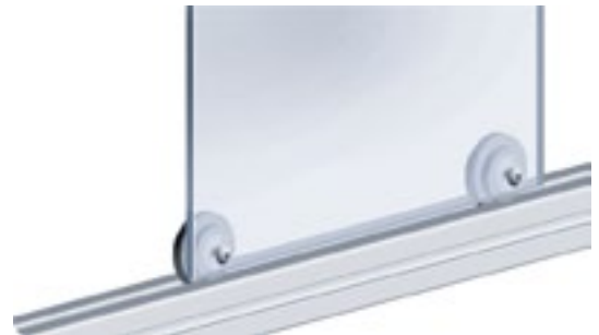
Rolle \phi 39 Roller \phi 39