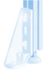
Bodenwinkel 45 Floor Bracket 45