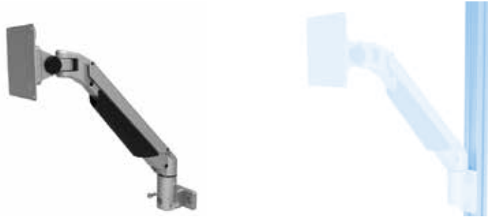
Monitorhalter 4 Achsen, höhenverstellbar Monitor Support 4-axis, Height Adjustable