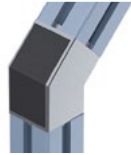
Winkelverbinder 45, 45° Angle Connector 45, 45°